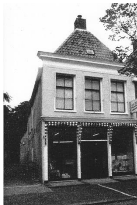
Geboortehuis van Sikke de Vries.

Sikke de Vries werd in Harlingen geboren op 1 november 1888, uit een geslacht van slepers en koperslagers. Zijn geboortehuis is nog te vinden in de Comediesteeg, een smal steegje aan de Lanen in het centrum van de stad.