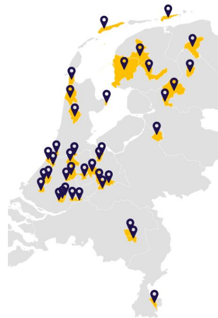
Afbeelding 1. Overzicht gemeentebrede Ondernemersfondsen in Nederland

Inmiddels zijn er circa veertig gemeentebrede ozb-fondsen op veel verschillende plekken in het land, waaronder ook vijf in Friesland: Leeuwarden (sinds 2009), Heerenveen (2015), Súdwest-Fryslân (2016), Terschelling (2017) en Schiermonnikoog (2012).